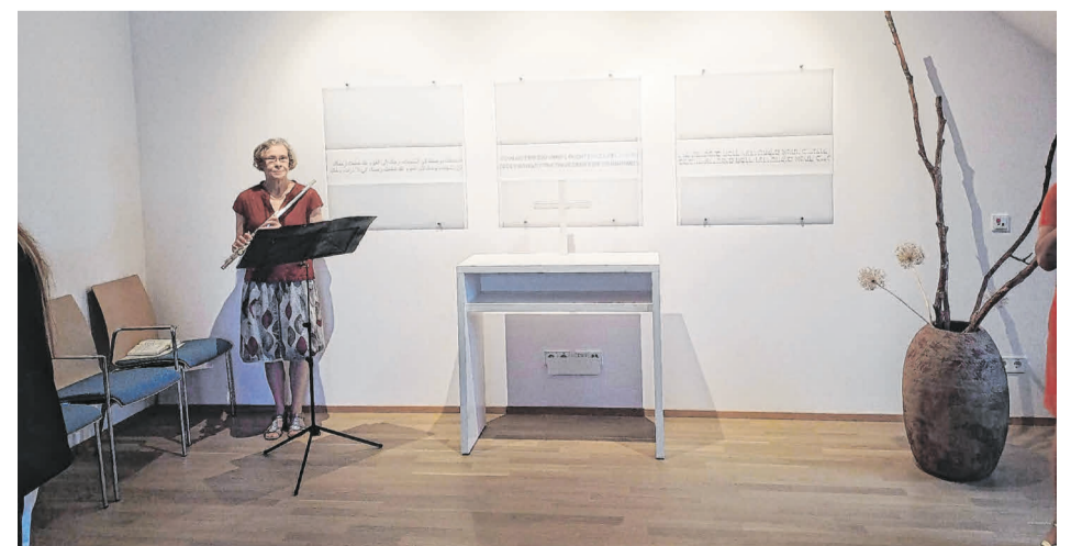
Der Raum der Stille.