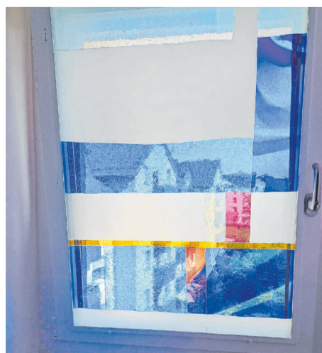
Kunstvolle Glasfenster im Raum der Stille.