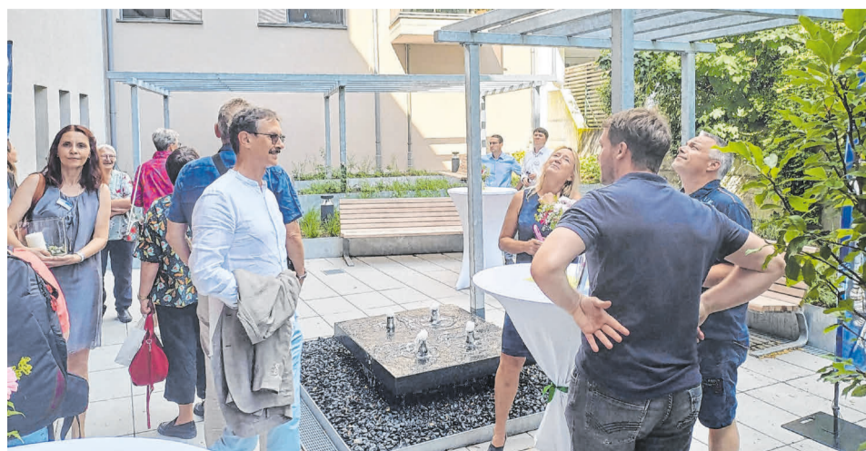
Im Innenhof sprudelt ein Brunnen.

Im Jahr 2020 gewann der Hospizverein, der inzwischen auf fast 1000 Mitglieder angewachsen ist, die St.-Elisabeth-Stiftung als Betreiber des Hospizes.